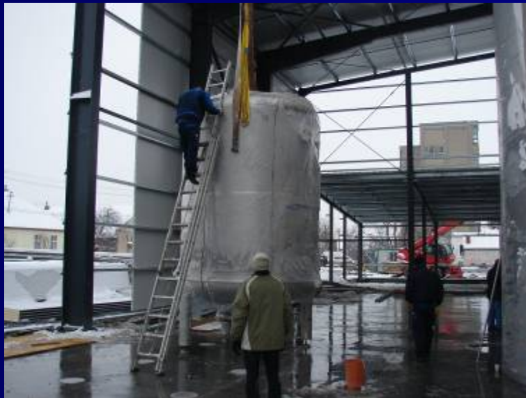
Modul compact de tratare