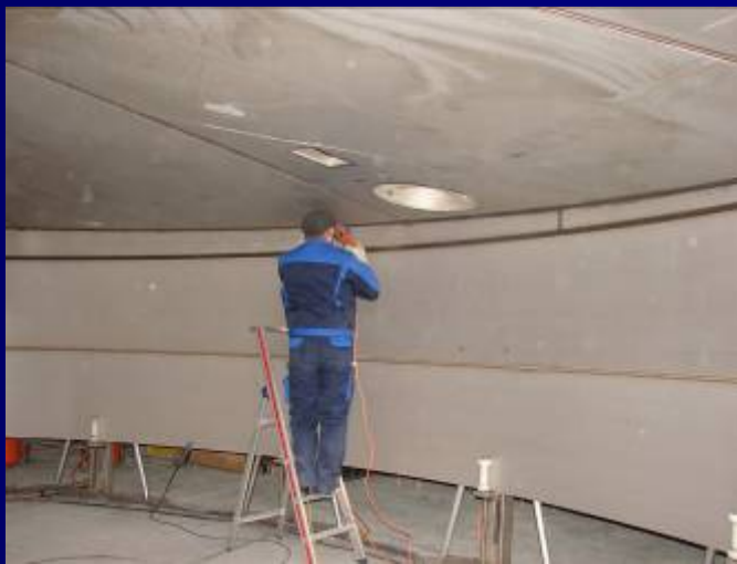
Sudare capac - perete rezervor