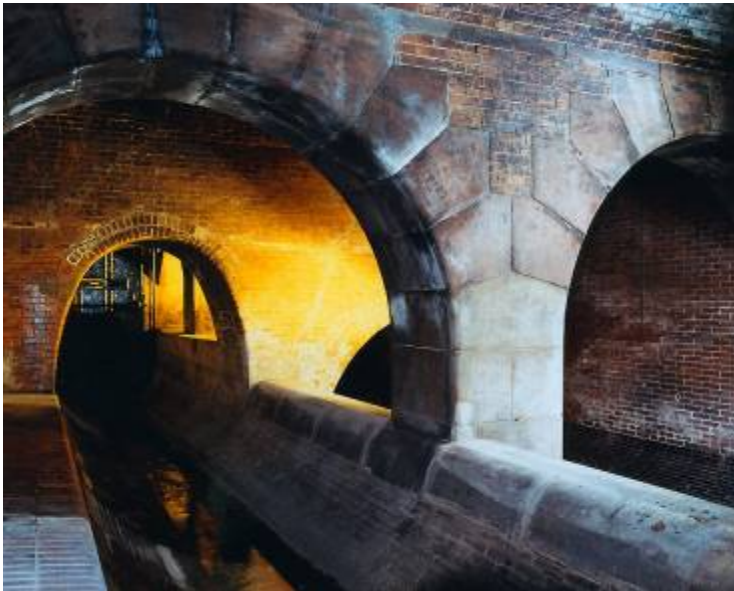
Bazine de retenție apă pluvială din sistemul de canalizare din München